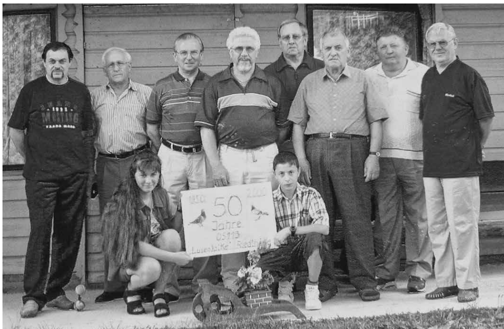
50-jähriges Jubiläum des Taubenvereins im Jahr 2000

Für ein Leben in Würde und Menschlichkeit